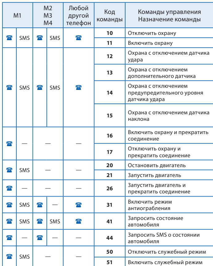
Таблица команд управления автосигнализацией StarLine